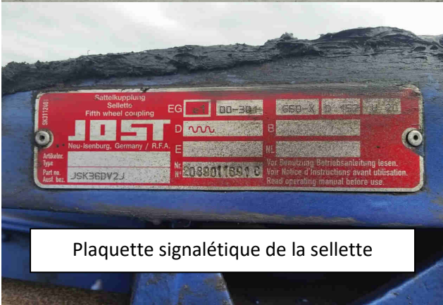
Plaque signalétique de la sellette