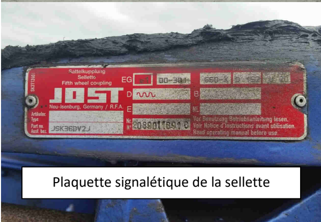
Plaquette signalétique de la sellette